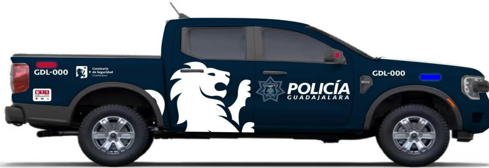
Balizamiento Patrolas de la Policía Municipal de Guadalajara