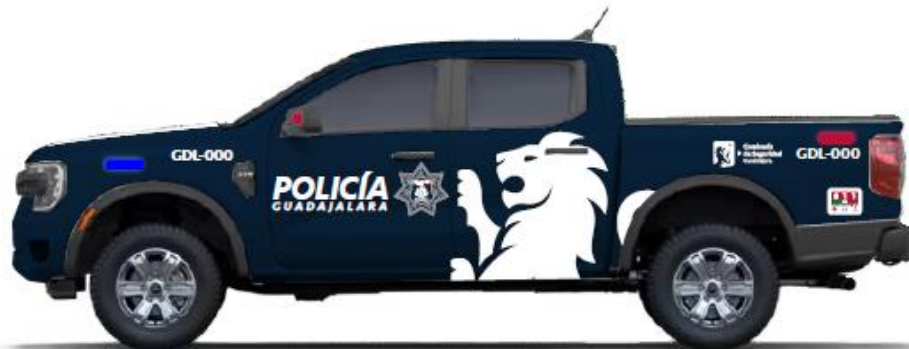
Balizamiento Patrullas de la Policía Municipal de Guadalajara