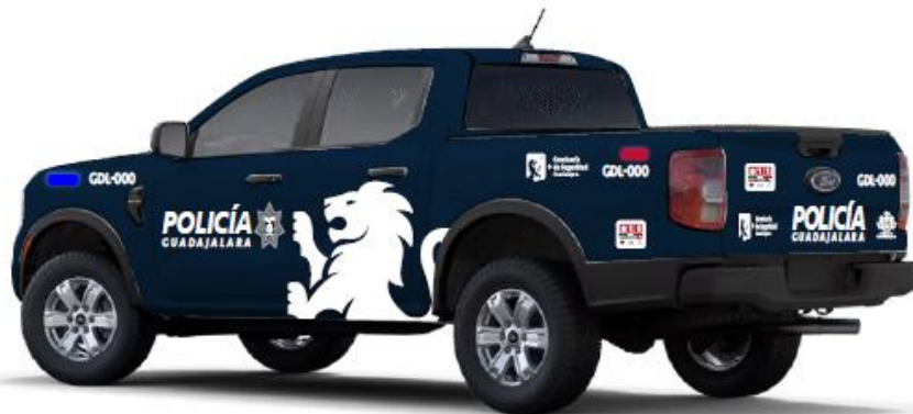
Balizamiento Patrolas de la Policía Municipal de Guadalajara