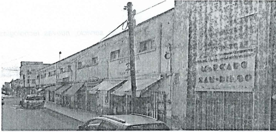
Locales comerciales principalmente por la calle Juan Manuel (Mercado San Diego)

Por lo anterior y en apego a lo que establece la fracción III del artículo 115 de la Constitución Política de los Estados Unidos Mexicanos, los Municipios tendrán a su cargo las funciones y servicios públicos siguientes: