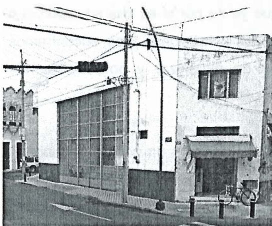
Centro Cultural San Diego.

Tocante a este inmueble, en visita al lugar se observa que se encuentra en evidente descuido; actualmente le falta mantenimiento integral, debido a que por un lado el Centro Cultural San Diego es atendido de forma directa con los recursos que le son asignados a la Dirección de Cultura; en lo que respecta al área de que dispone el Sindicato de Servidores Públicos del Ayuntamiento de Guadalajara se observa que el mantenimiento que se le ha dado es de forma superficial y lo que resta para el uso de los locales comerciales están en total deterioro. Por ello, considero importante también generar el peritaje estructural para ver las condiciones de su cubierta, debido que en algunos puntos la bóveda del edificio presenta cierta deflexión.