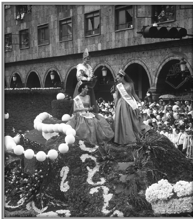
Desfile de las Fiestas de Octubre en la Avenida 16 de Septiembre.