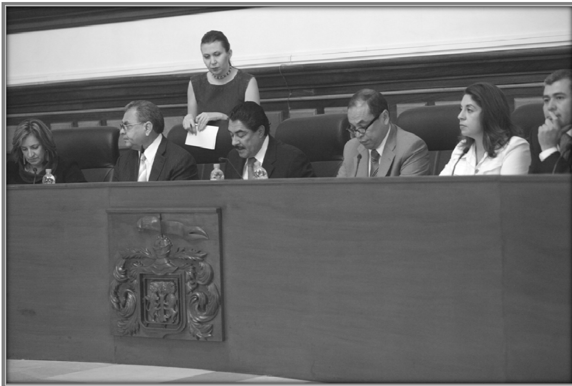
Sesión de Ayuntamiento.

III. En desahogo del tercer punto del orden del día, al no haber más asuntos por tratar, se dio por concluida la sesión.