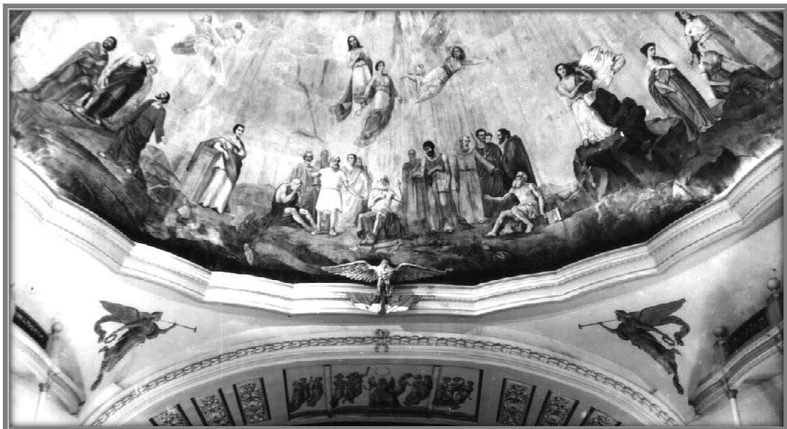
Detalle del mural del Teatro Degollado, 1954.