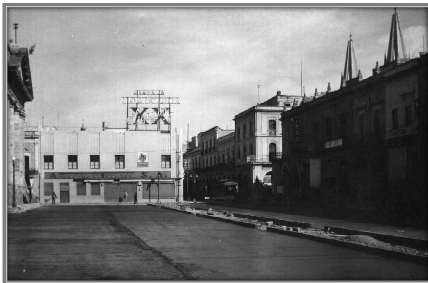
Calle Colón, frente a Plaza Universidad, 1938.

También vivía en Guadalajara la familia Colón Larriatigue, que se decía descendiente de Colón.