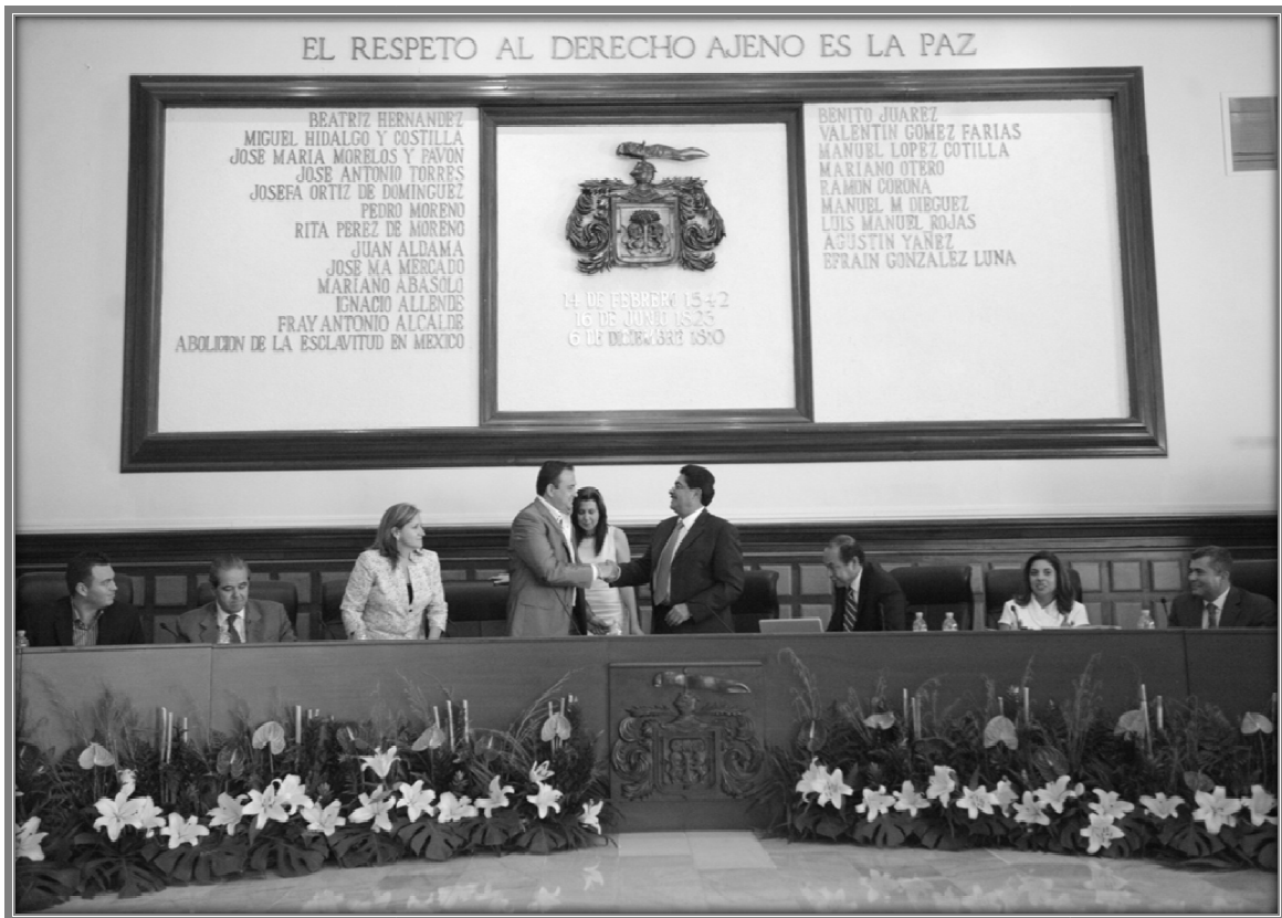
Sesión de Ayuntamiento.