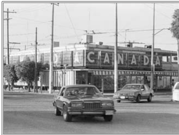
Fábrica de Calzado Canadá

En 1970 se llegó a tener una plantilla laboral de seis mil personas repartidos en tres turnos, en su mayoría a destajo, sin contar el personal administrativo y de transporte con una amplia red de tiendas distribuidas en la República Mexicana, con más de mil sucursales, estratégicamente ubicadas en las importantes ciudades del la nación y por lo consiguiente los sueldos de los empleados eran los más altos de la media nacional, y no sólo trasformó la calidad de vida al Tapatío, si no de la nación entera.