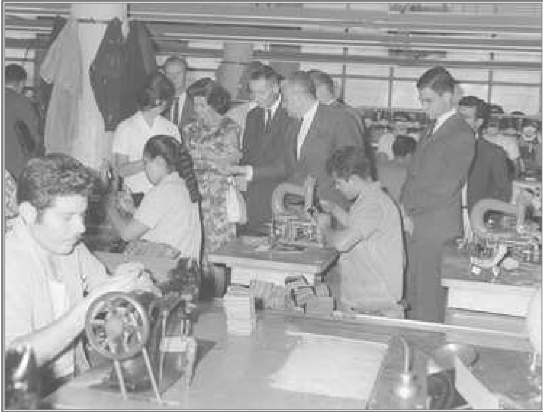
Calzado Canadá producía hasta 65 mil pares de zapatos al día (1964).