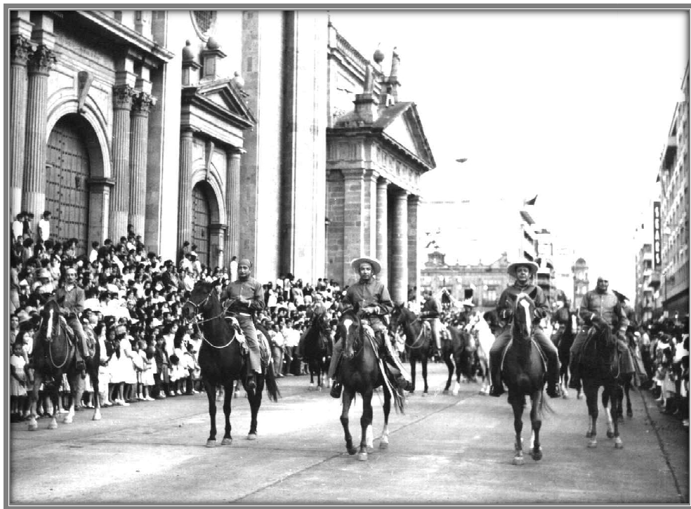
Desfile Conmemorativo del 16 de Septiembre, 1962.

El carácter de los habitantes de Guadalajara era franco y sincero, hospitalario y expansivo, aunque retenido por las conveniencias sociales que reclamaban cierta reserva que se pretendía hacer pasar por discreción, y determinado aislamiento para aparentar dignidad.