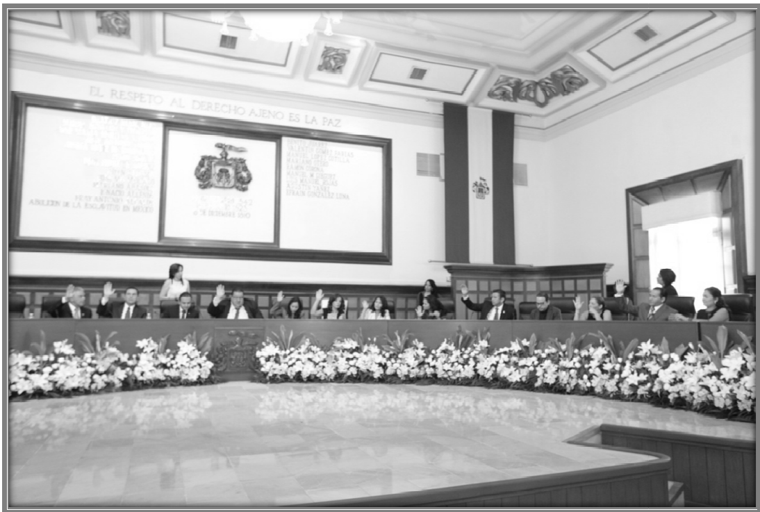
Sesión de Ayuntamiento.