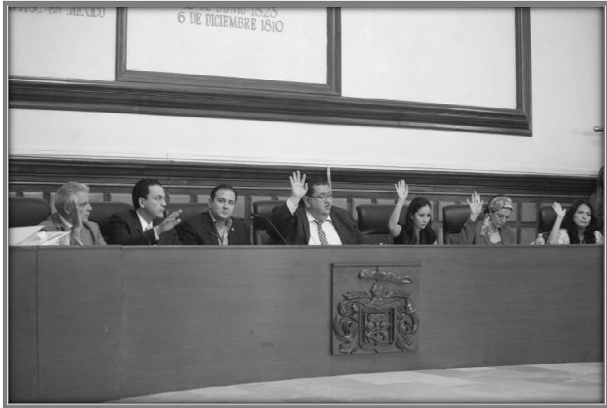
Sesión de Ayuntamiento.