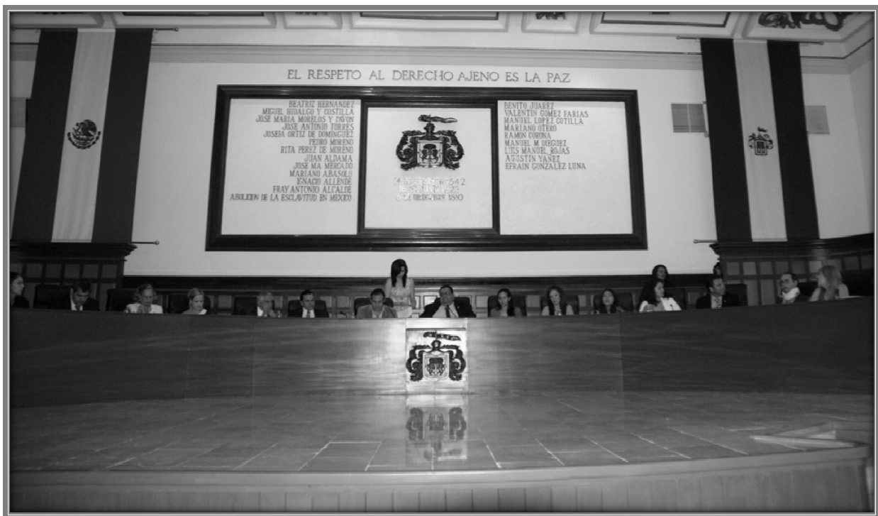
Sesión de Ayuntamiento.