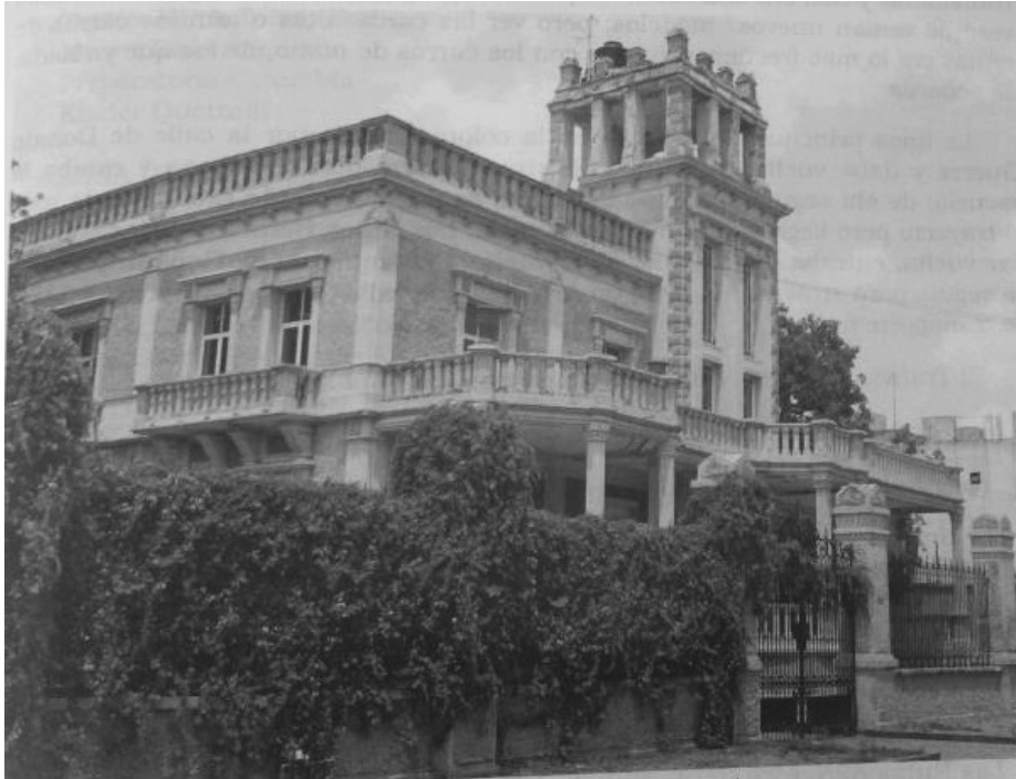
Castillo familia Razura, calle de Francia.

L a Colonia Moderna, considerada la primera ciudad jardín de Guadalajara, se urbanizó siguiendo los patrones norteamericanos y europeos marcando la ruptura de los conceptos arquitectónicos propios de la época colonial.