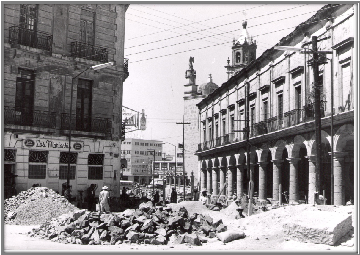
Obras en proceso de la "Plaza de los Mariachis", 1962.