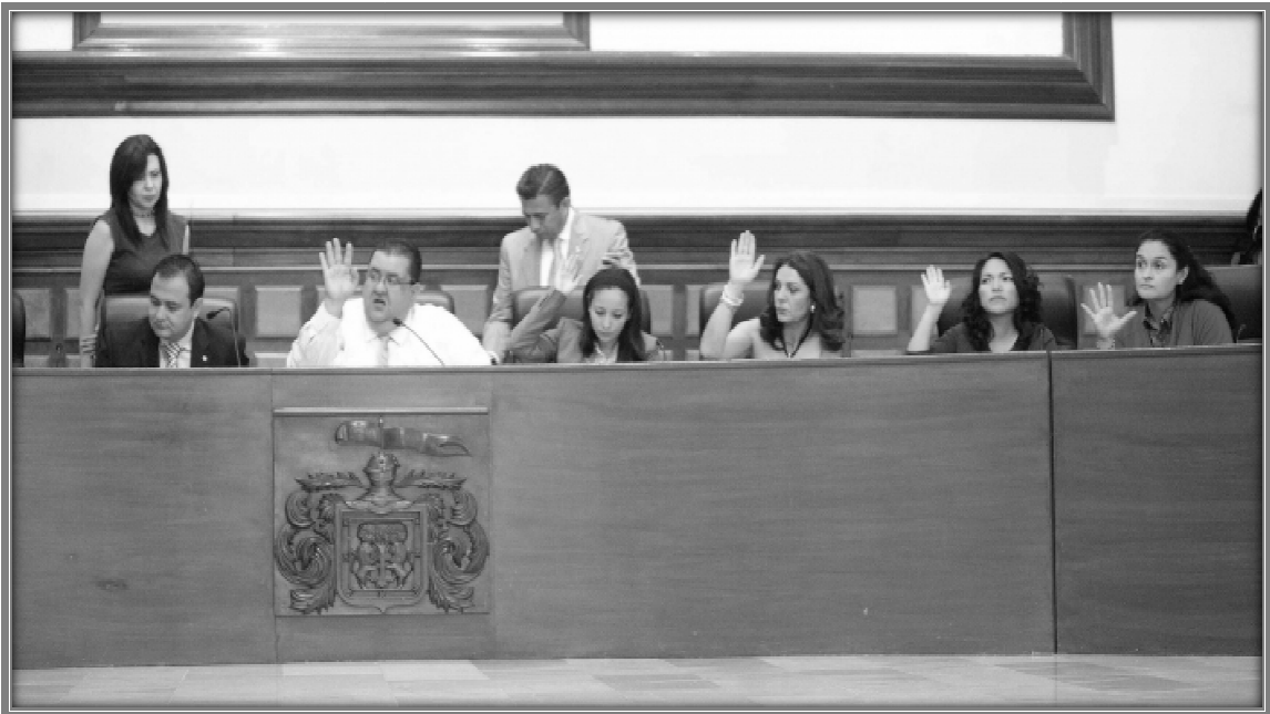
Sesión de Ayuntamiento.