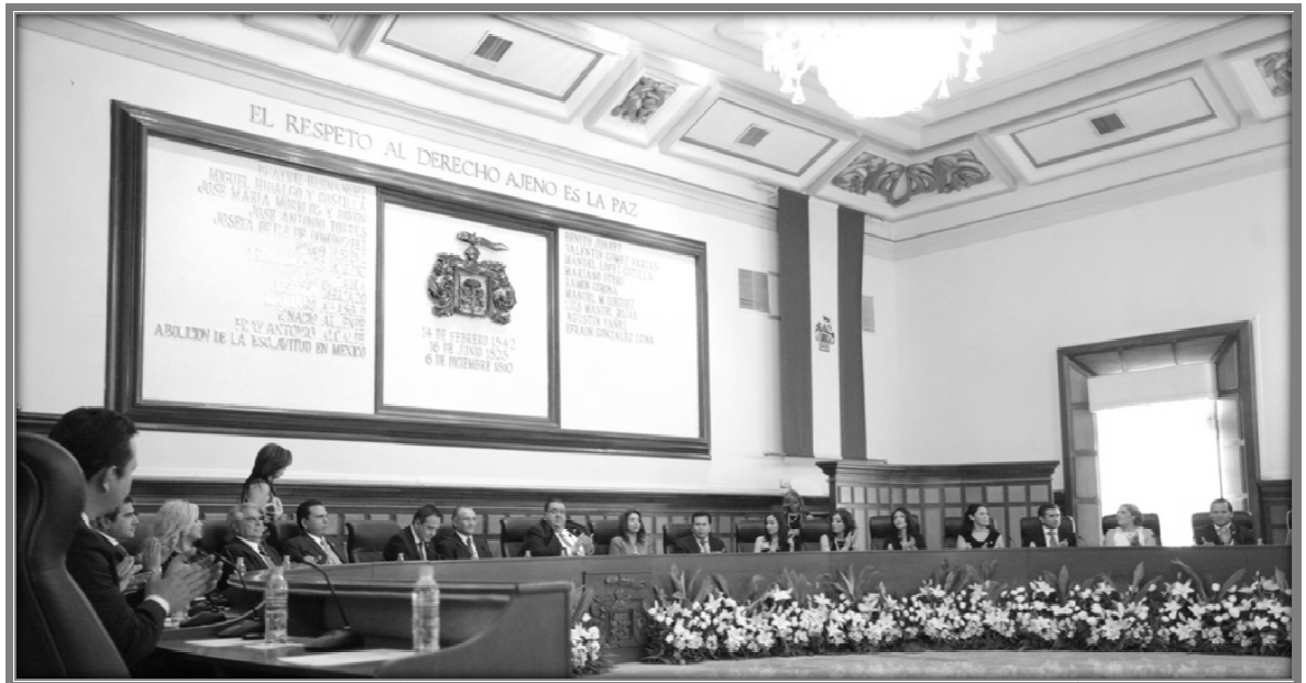
Sesión de Ayuntamiento.