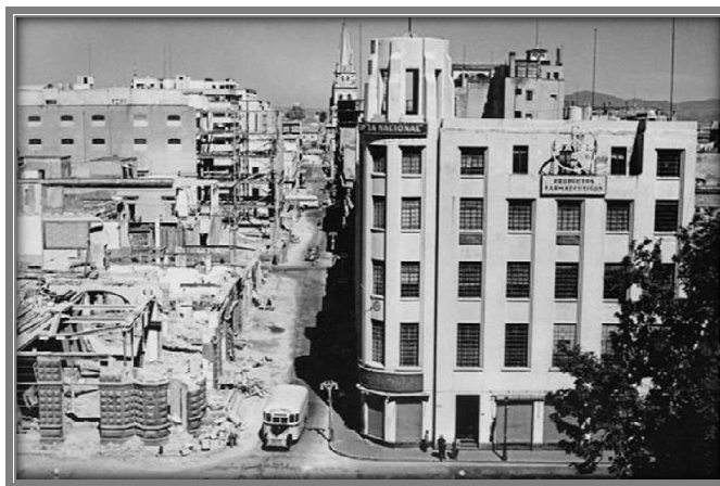
Avenida 16 de Septiembre en su cruce con la calle Prisciliano Sánchez, 1949.

Es hasta 1949, y con el apoyo económico que obtuvo el Ayuntamiento de Guadalajara de los mismos vecinos y comerciantes, cuando se inician las labores. Algunos que colaboraron con esta buena acción fueron: La Ciudad de París, S.A., El Nuevo Japón, Hotel Cosmopolita, Joyería La Esmeralda, Droguería Occidental, Las Fábricas de Francia, Hotel Alemán y la Sombrerería José Audeffred, sólo por mencionar algunos. Con el nuevo diseño se exaltó aun más la vocación comercial y la belleza de la “Perla de Occidente”.