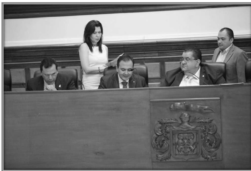
Sesión de Ayuntamiento.

VI. En desahogo del sexto punto del orden del día, correspondiente a asuntos varios, al no registrarse ningún edil para hacer uso de la voz, se dio por concluida la sesión.