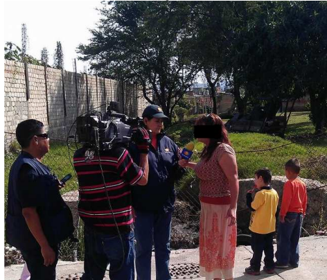
Imagen en el que se aprecia la intervención de los medios en el momento de quejas por parte de los colonos, se aprecian menores en la zona, consumiendo alimentos y esto es un foco de infección, ya que en el lugar hay hasta animales en estado de descomposición.

Es por ello, que someto a consideración de éste órgano de gobierno municipal, la presente iniciativa de acuerdo con turno a Comisión que tiene como finalidad el que se realice una evaluación técnica de la problemática que presentan los vecinos de la colonia Lagos de Oriente, por la falta de drenaje y acumulación de aguas residuales en el la calle de Dinar, entre las calles Presa Osorio y Rublo y en su momento se adquiera por la modalidad que se estime pertinente el terreno necesario para dar continuidad la calle Dinar; haciendo hincapié que en caso de no contar con recursos este año, sea considerado en el presupuesto del año próximo.