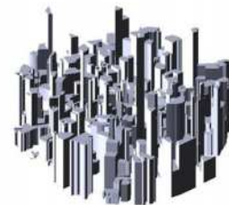
Ejemplo de ciudad compacta