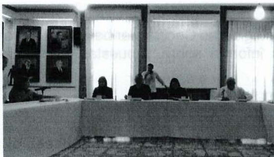
Imagen 6. Vigésima Novena Sesión Ordinaria