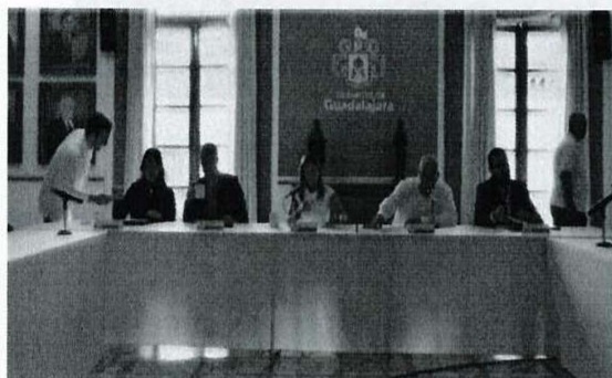
Imagen 11. Trigésima Cuarta Sesión Ordinaria