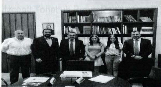
Imagen 2. Vigésima Quinta Sesión Ordinaria