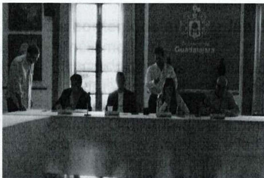
Imagen 12. Trigésima Quinta Sesión Ordinaria