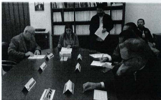
Imagen 3. Vigésima Sexta Sesión Ordinaria