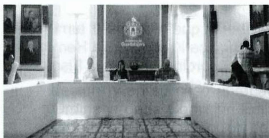
Imagen 8. Trigésima Primera Sesión Ordinaria