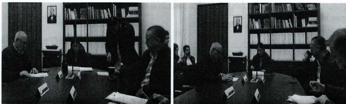
Imagen 4. Vigésima Séptima Sesión Ordinaria.