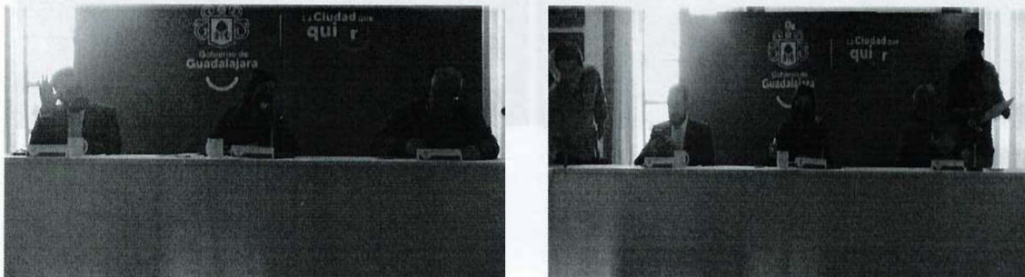
Imagen 5. Vigésima Octava Sesión Ordinaria