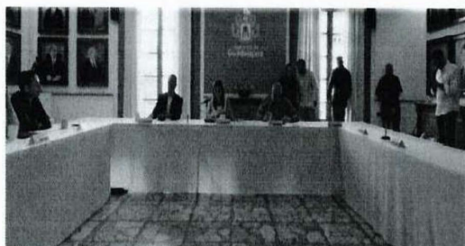
Imagen 9. Trigésima Segunda Sesión Ordinaria