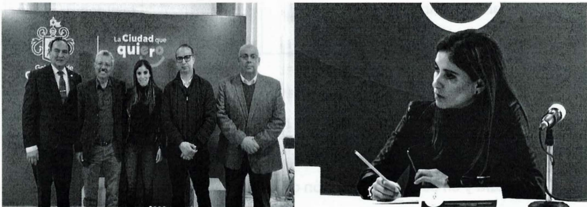
Imagen 3. Décima Cuarta Sesión Ordinaria

La presente página 15 de 29 corresponde al segundo informe anual pormenorizado de las actividades realizadas por la Comisión Edilicia de Transparencia, Rendición de Cuentas y Combate a la Corrupción