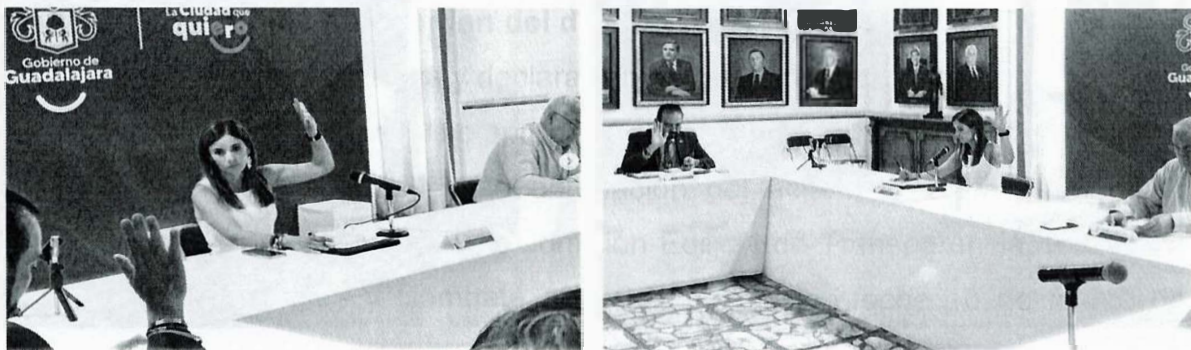
Imagen 7. Décima Octava Sesión Ordinaria

La presente página 19 de 29 corresponde al segundo informe anual pormenorizado de las actividades realizadas por la Comisión Edilicia de Transparencia, Rendición de Cuentas y Combate a la Corrupción