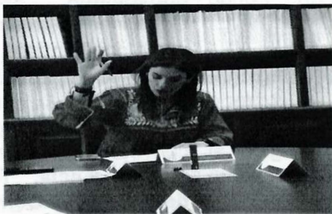
Imagen 12. Vigésima Tercera Sesión Ordinaria