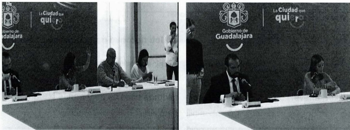
Imagen 9. Vigésima Sesión Ordinaria

La presente página 21 de 29 corresponde al segundo informe anual pormenorizado de las actividades realizadas por la Comisión Edilicia de Transparencia, Rendición de Cuentas y Combate a la Corrupción