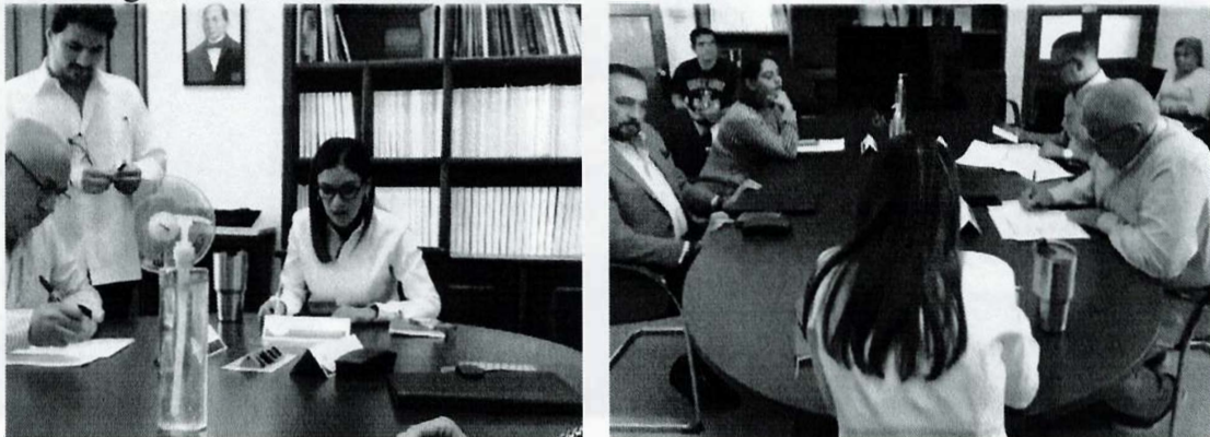
Imagen 10. Vigésima Primera Sesión Ordinaria

La presente página 22 de 29 corresponde al segundo informe anual pormenorizado de las actividades realizadas por la Comisión Edilicia de Transparencia, Rendición de Cuentas y Combate a la Corrupción