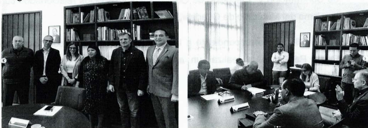
Imagen 2. Décima Tercera Sesión Ordinaria

La presente página 14 de 29 corresponde al segundo informe anual pormenorizado de las actividades realizadas por la Comisión Edilicia de Transparencia, Rendición de Cuentas y Combate a la Corrupción