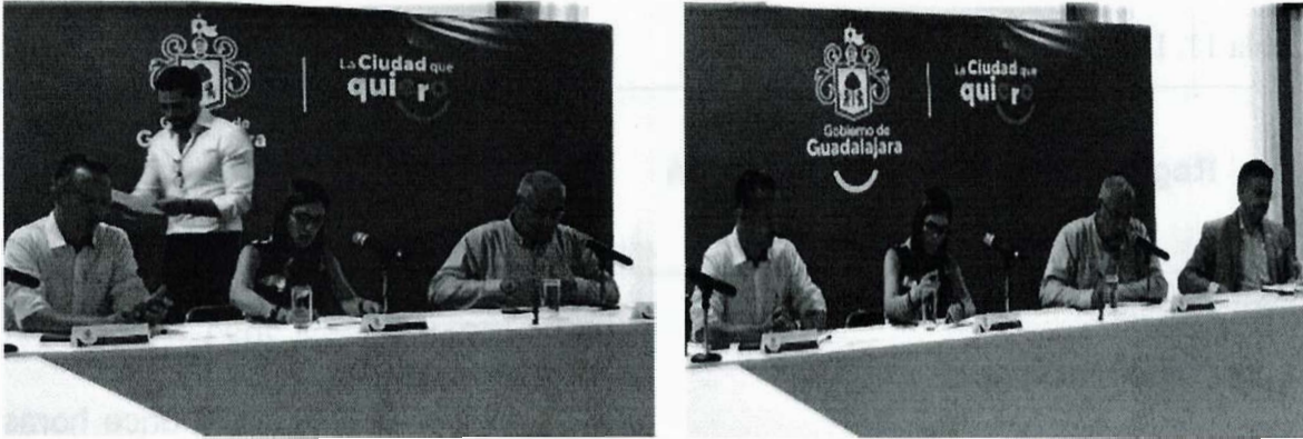
Imagen 11. Vigésima Segunda Sesión Ordinaria

Los asuntos turnados a esta Comisión y que fueron dados a conocer en esta sesión son los siguientes: