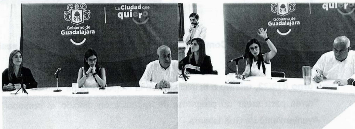
Imagen 6. Décima Séptima Sesión Ordinaria

La presente página 18 de 29 corresponde al segundo informe anual pormenorizado de las actividades realizadas por la Comisión Edilicia de Transparencia, Rendición de Cuentas y Combate a la Corrupción