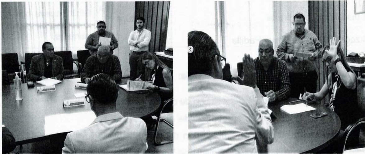
Imagen 1. Décima Segunda Sesión Ordinaria

Los asuntos turnados a esta Comisión y que fueron dados a conocer en esta sesión son los siguientes: