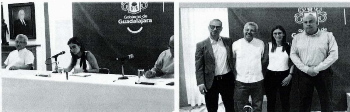
Imagen 8. Décima Novena Sesión Ordinaria

La presente página 20 de 29 corresponde al segundo informe anual pormenorizado de las actividades realizadas por la Comisión Edilicia de Transparencia, Rendición de Cuentas y Combate a la Corrupción