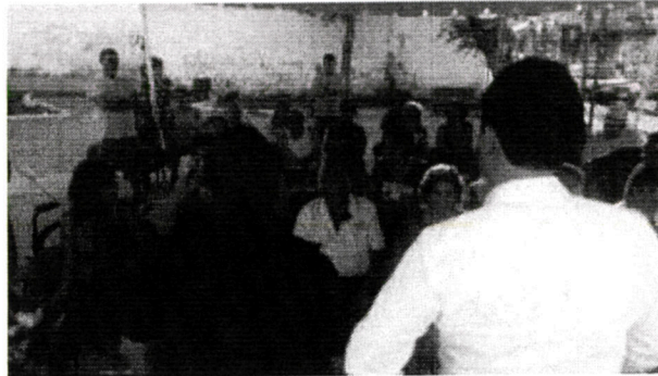
10 Agosto 2016.- Unidad Habitacional Industria