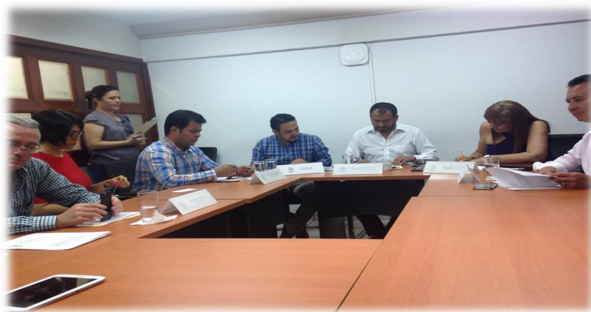
SESIÓN DE LA COMISIÓN EDILICIA DE OBRAS PÚBLICAS DEL MES DE MAYO