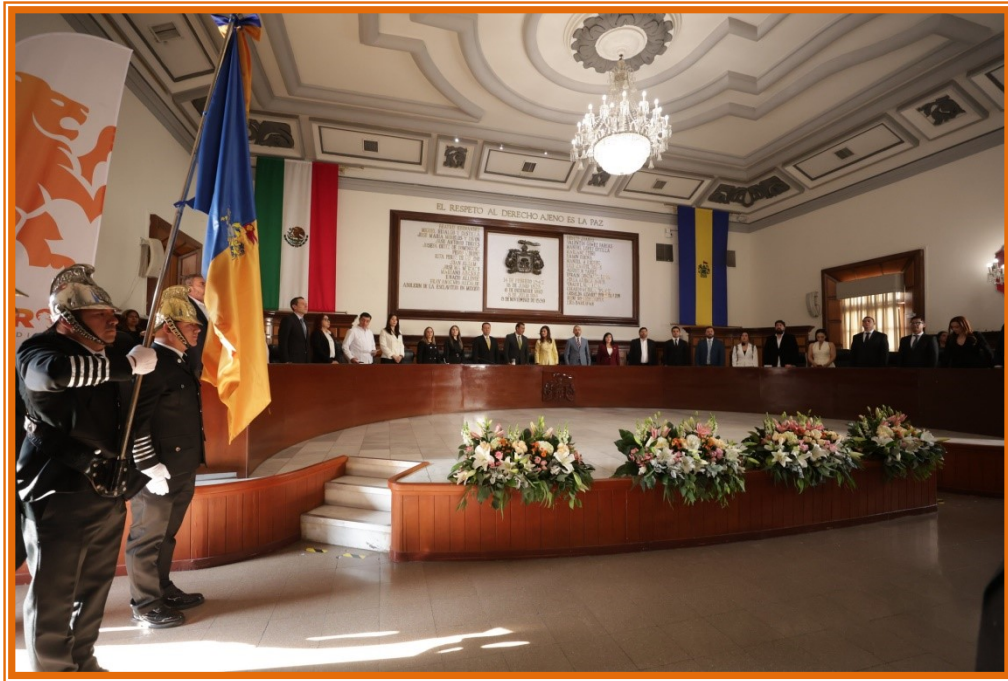
Sesión de Ayuntamiento.