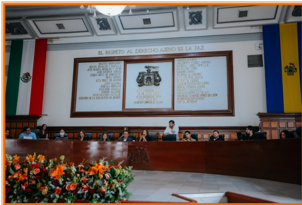
Sesión de Ayuntamiento.