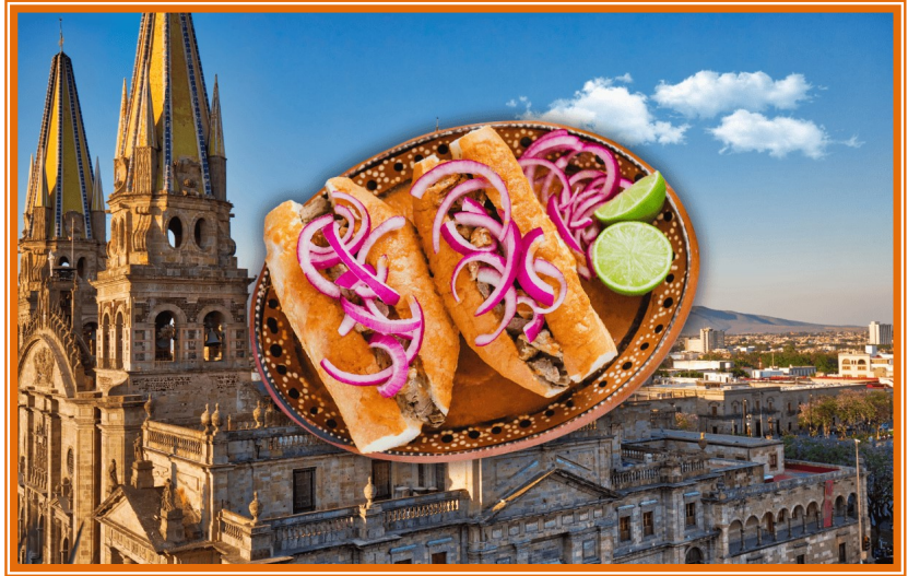
Fotografía. Por: SUN. Periódico El Informador, 6 de septiembre de 2025

Mucho se habla de su origen o creación convertida en leyenda y ha causado gran polémica entre los comerciantes del ramo que atribuyen su descubrimiento a tal o cual persona incluso como parte de la familia, dice un refrán “papelito habla”; así pues, entre “dimes y diretes” se tiene como en la alacena un gran número de historias relacionadas con este manjar confeccionado en nuestros días con diversos ingredientes y, desde luego, no son los mismos; por ejemplo, habrá quienes no cuentan con frijoles, la base del pan birote salado; por otra parte, la cebolla desflemada se ha popularizado tanto que seguramente la totalidad de quienes la preparan la utilizan como elemento insustituible; el limón se añadió porque es gusto de los tapatíos ponerle limón a todo.