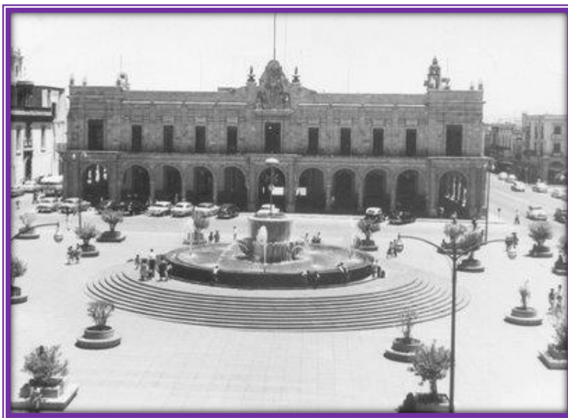
Plaza Guadalajara, 1952. Vista al Palacio Municipal.

Esta popular plaza se encuentra frente a la catedral, conocida primero como Plaza del Ayuntamiento, Plaza de la Fundación, Plaza de los Laureles y desde 1992, Plaza Guadalajara; le sirve de “atrio laico” a la Catedral y de “vestíbulo” al Palacio Municipal.