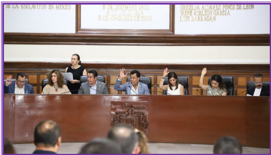
Sesión de Ayuntamiento.