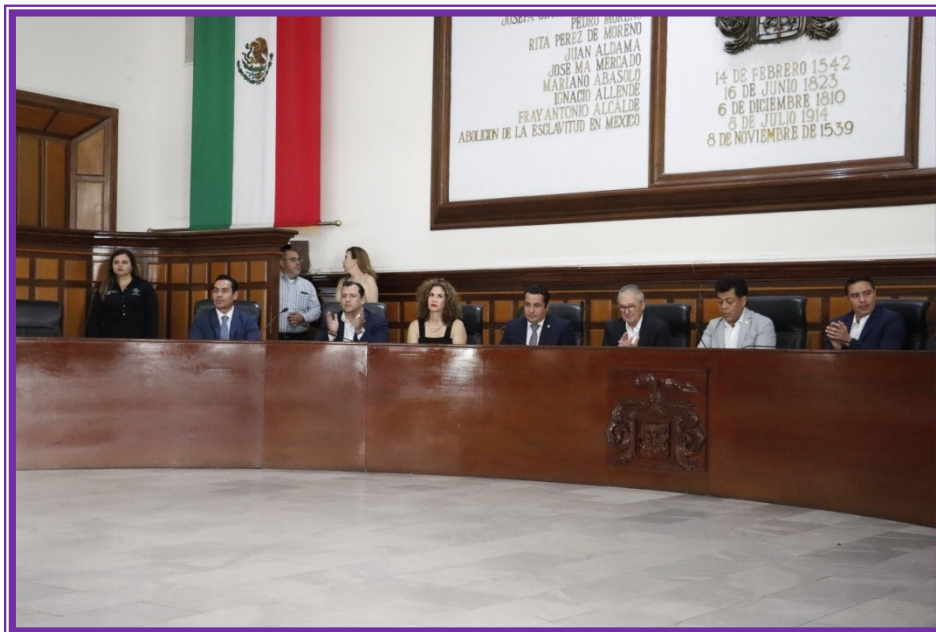
Sesión de Ayuntamiento.