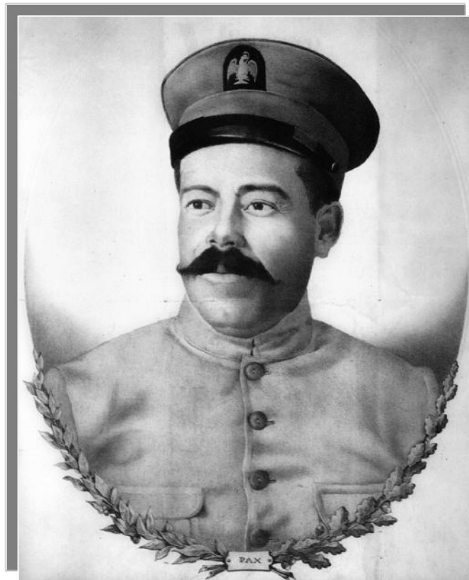
Doroteo Arango, “Pancho Villa”.

En febrero de 1926, sus restos fueron profanados desapareciendo la cabeza del apodado “Centauro del Norte”. En 1976 sus restos mortales fueron trasladados al Monumento de la Revolución.