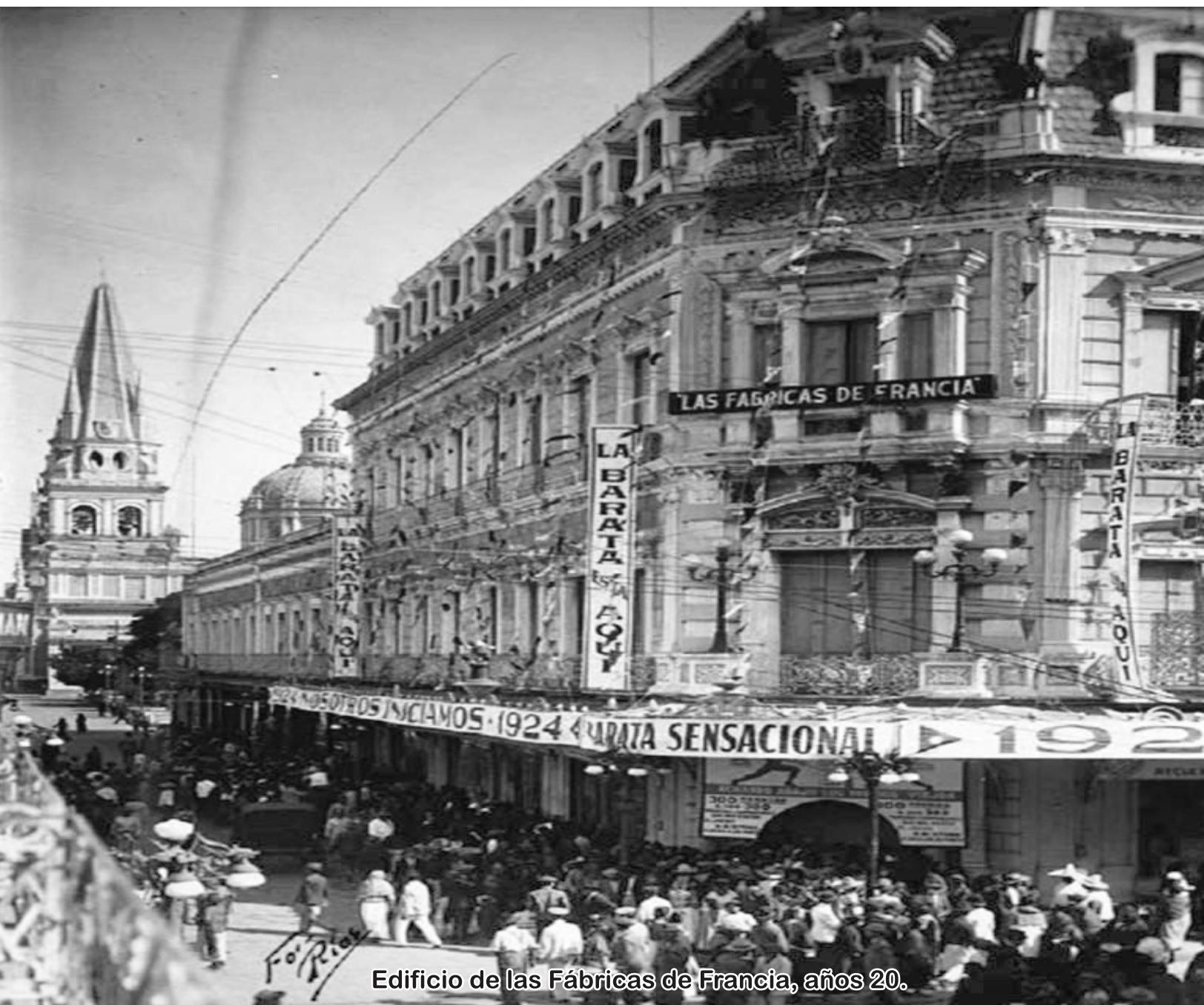
Edificio de las Fábricas de Francia, años 20.

Año 98 · JUNIO DE 2015 · 20 de agosto de 2015 Primera Sección