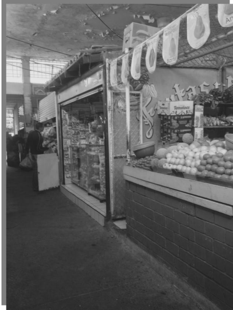
Mercado General Plutarco Elías Calles.