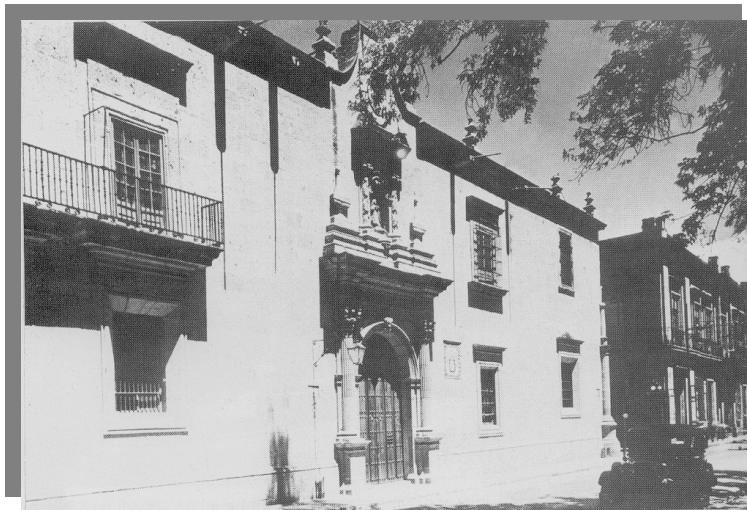
Liceo de Varones, hoy Museo Regional de Guadalajara, ubicado en la calle de Liceo número 60.

Esto era aprovechado astutamente por los sectores más retrógrados y conservadores de Guadalajara, haciendo campañas de desprestigio y señalando que “fuera de los seminarios no había enseñanza posible”. Era llamada la escuela de los herejes.