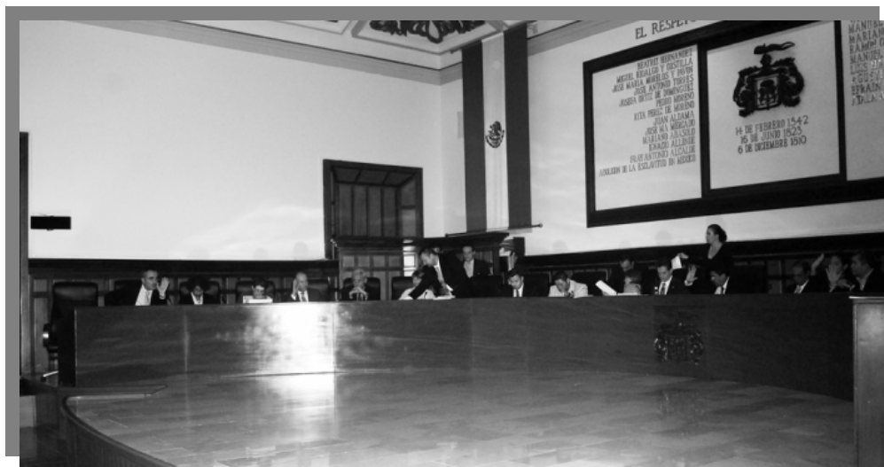
Sesión de Ayuntamiento.