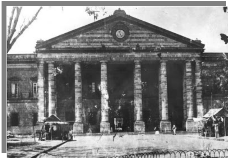
Penitenciaria de Parque de la

En la parte posterior del edificio está el departamento para talleres, el baño, el jardín y todo lo concerniente a un establecimiento de esta especie. Contiene actualmente 1,500 presos y está desocupada más de la mitad del edificio. Todo está circundado de unos sólidos y espesos muros y contramuro. Bastan seis u ocho soldados para vigilar tanto preso”.