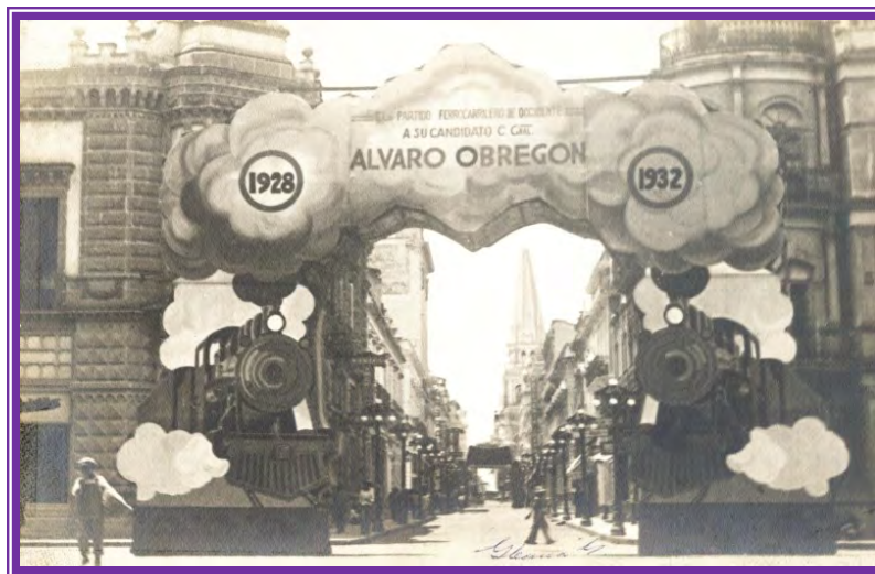
Arcos triunfales utilizados como propaganda política del general Álvaro Obregón sobre la calle San Francisco (hoy Avenida 16 de Septiembre) de sur a norte. Al fondo la Catedral de Guadalajara, 1928.

Finalmente, el episodio histórico del 8 de julio de 1914 quedó grabado para la posteridad como el día en que las tropas de Álvaro Obregón entraron a Guadalajara para derrotar a Victoriano Huerta.