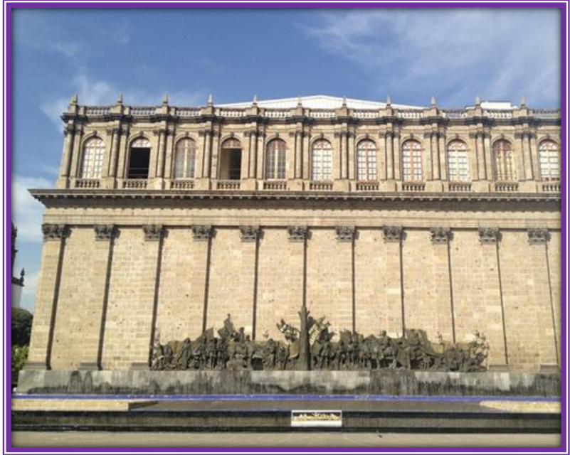
Conjunto escultórico en la Plaza Fundadores, a espaldas del Teatro Degollado

E n la celebración del 480 Aniversario de la cuarta y definitiva fundación de la ciudad de Guadalajara en el Valle de Atemajac, queremos transportar al lector en el tiempo para que viva el emotivo momento de la ceremonia, apoyándonos para ello del poder de la imaginación y de los elementos plasmados en el conjunto escultórico que se ubica a espaldas del Teatro Degollado, en la denominada Plaza Fundadores, anteriormente nombrada Plaza Mayor y luego Plazuela de San Agustín, donde se representa este suceso histórico y se patenta el valor, la valentía y la devoción a Dios y a su Majestad, el Rey.