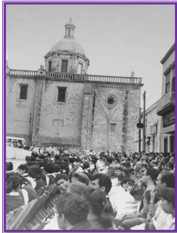
Teatro Degollado, vista de atrás, 10 diciembre de 1960.

La obra en bronce la realizó Rafael Zamarripa, se ubica entre las calles Morelos y Ángela Peralta, para que al contemplarla rescatemos su simbolismo y recordemos el nacimiento de nuestra bella y noble ciudad.