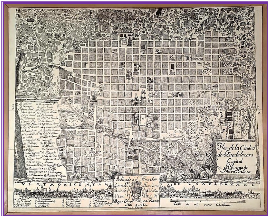
Plan de la Ciudad de Guadalajara Capital del Reyno de la Nueva Galicia (1800)

Actualmente, la traza urbana de Guadalajara sigue un ordenamiento muy variado, sus calles, avenidas, así como la arquitectura de sus nuevos edificios van adquiriendo un diseño moderno como las ciudades del siglo XXI lo requieren, sin embargo, su esencia ha perdurado a través del tiempo, su gente es hospitalaria digna de una noble y leal ciudad, no se diga de sus edificios arquitectónicos que la representan, hoy por hoy, mantiene una alta demanda turística y ocupa un lugar privilegiado en las personas, quienes nos honran con su visita para conocer nuestra historia.