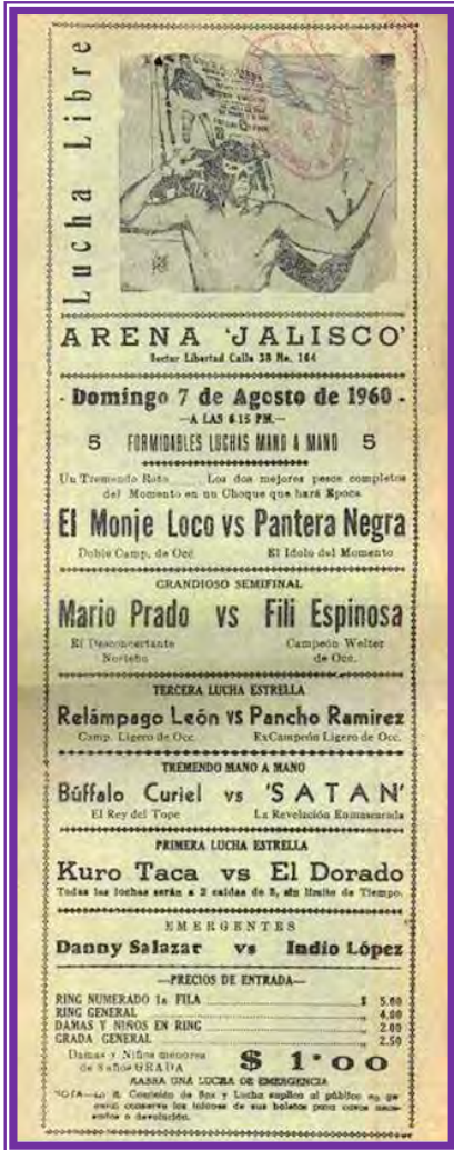
AMG. Programa. Arena "Jalisco", 5 Formidables luchas mano a mano. 7 de agosto de 1960.