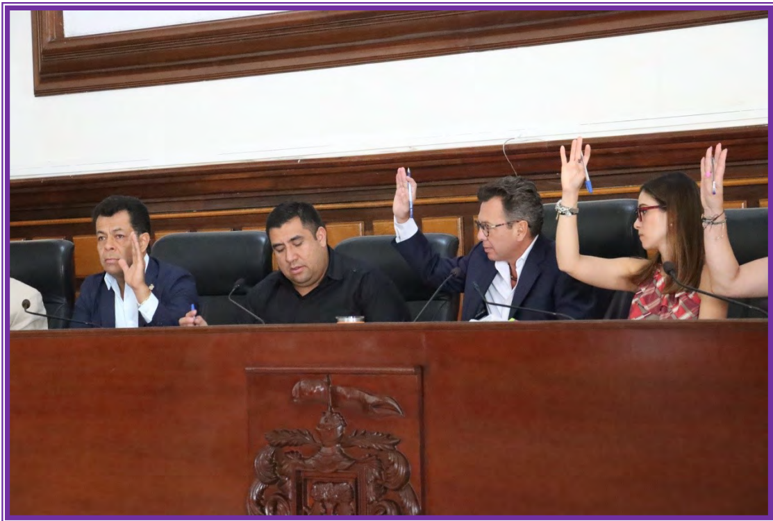
Sesión de Ayuntamiento.