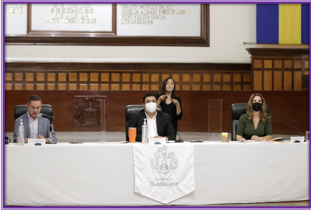
Sesión de Ayuntamiento.