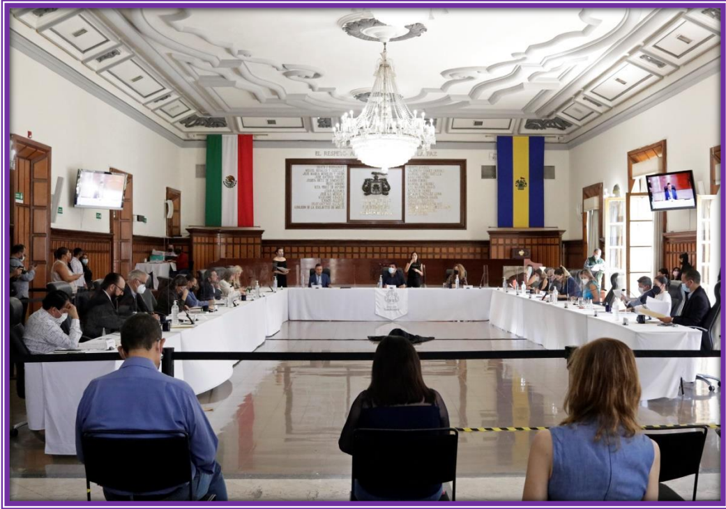
Sesión de Ayuntamiento.