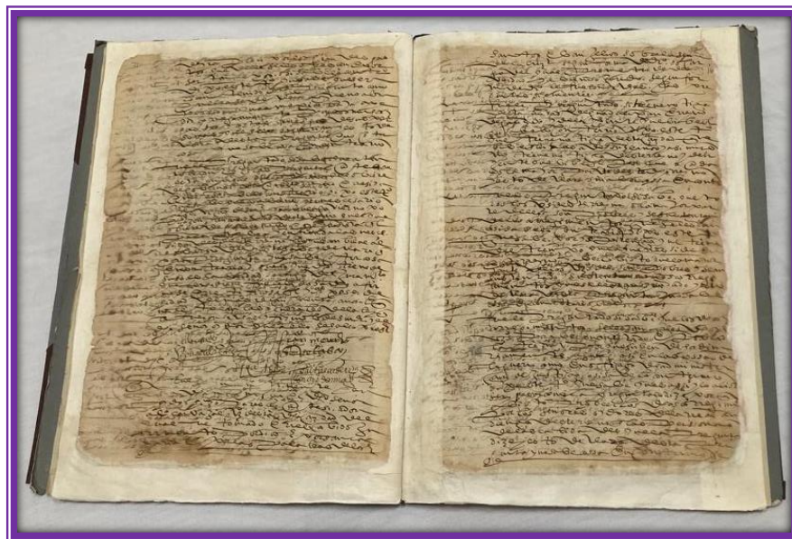
Ramo Administración Colonial, 9 de abril de 1573. AMG

Este documento ha cautivado a quienes vienen a conocer el pasado de nuestra ciudad. Se ha sometido a técnicas y métodos de restauración para contribuir a su preservación y los usuarios puedan consultarlo para realizar sus estudios de investigación o simplemente saciar su curiosidad al conocer la memoria escrita de Guadalajara.