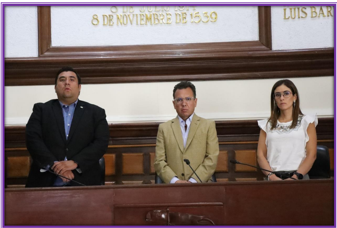
Sesión de Ayuntamiento.