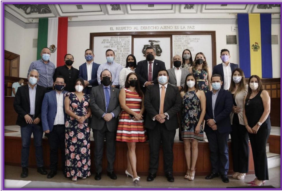
Sesión de Ayuntamiento.