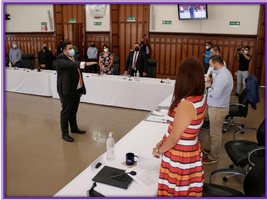
Sesión de Ayuntamiento.