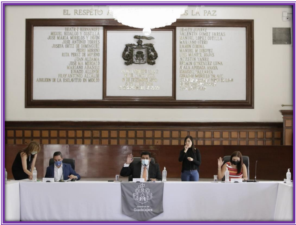
Sesión de Ayuntamiento.