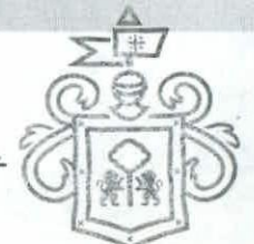
Gobierno de Guadalajara Tesorería