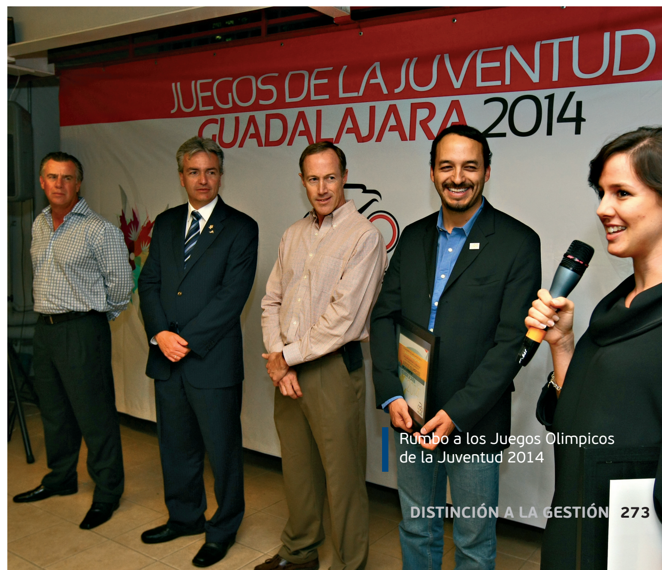
Rumbo a los Juegos Olímpicos de la Juventud 2014