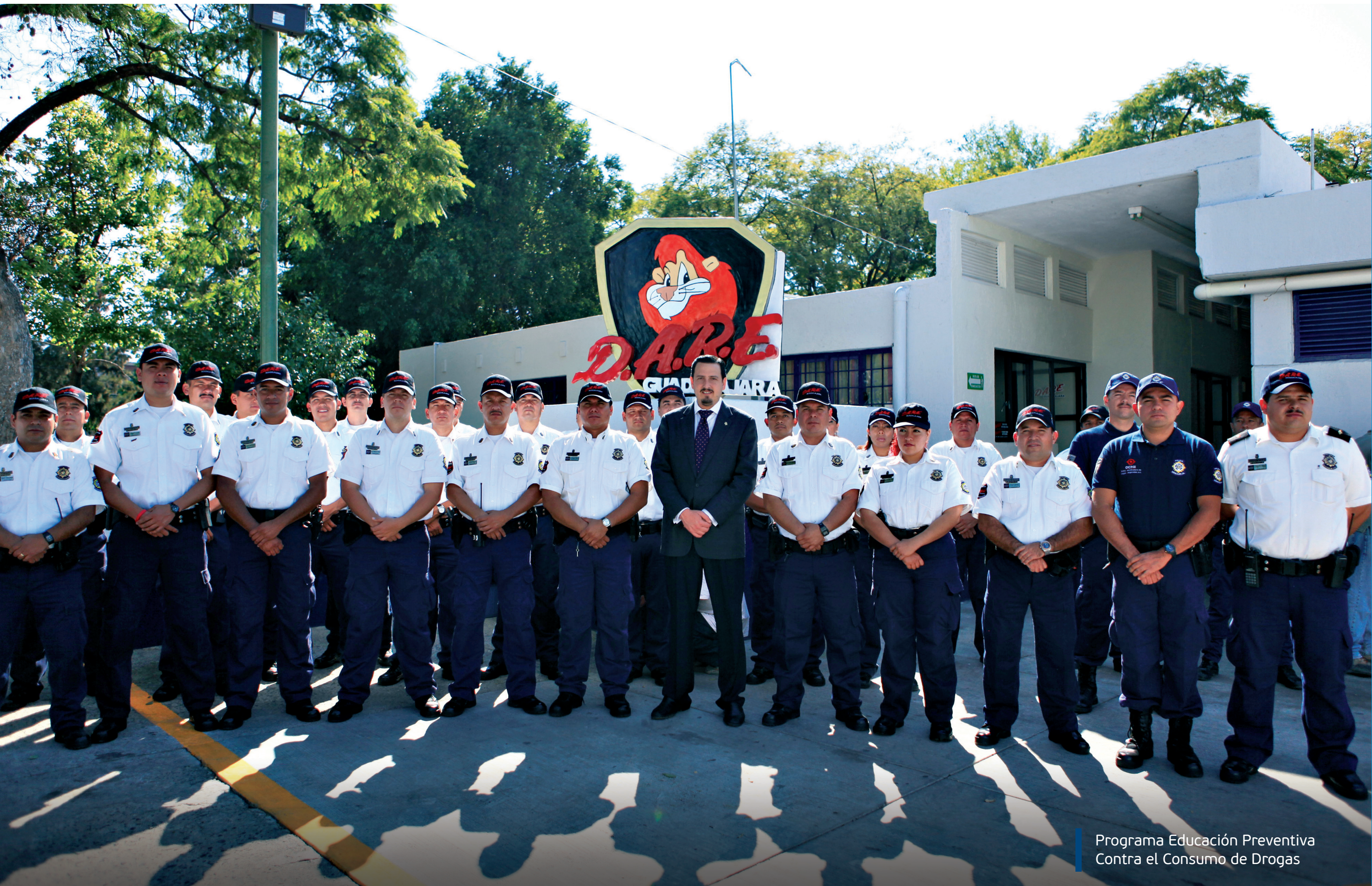
Programa Educación Preventiva Contra el Consumo de Drogas