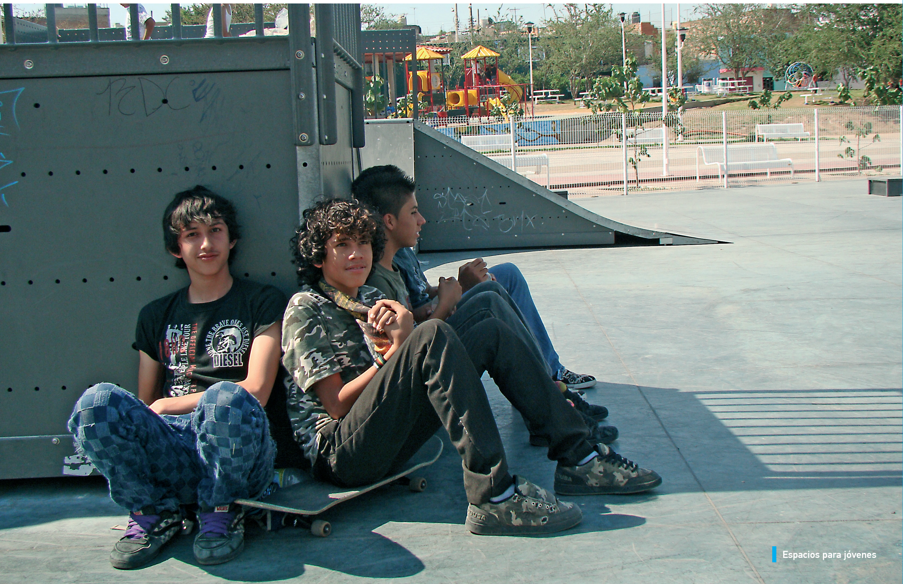
Espacios para jóvenes