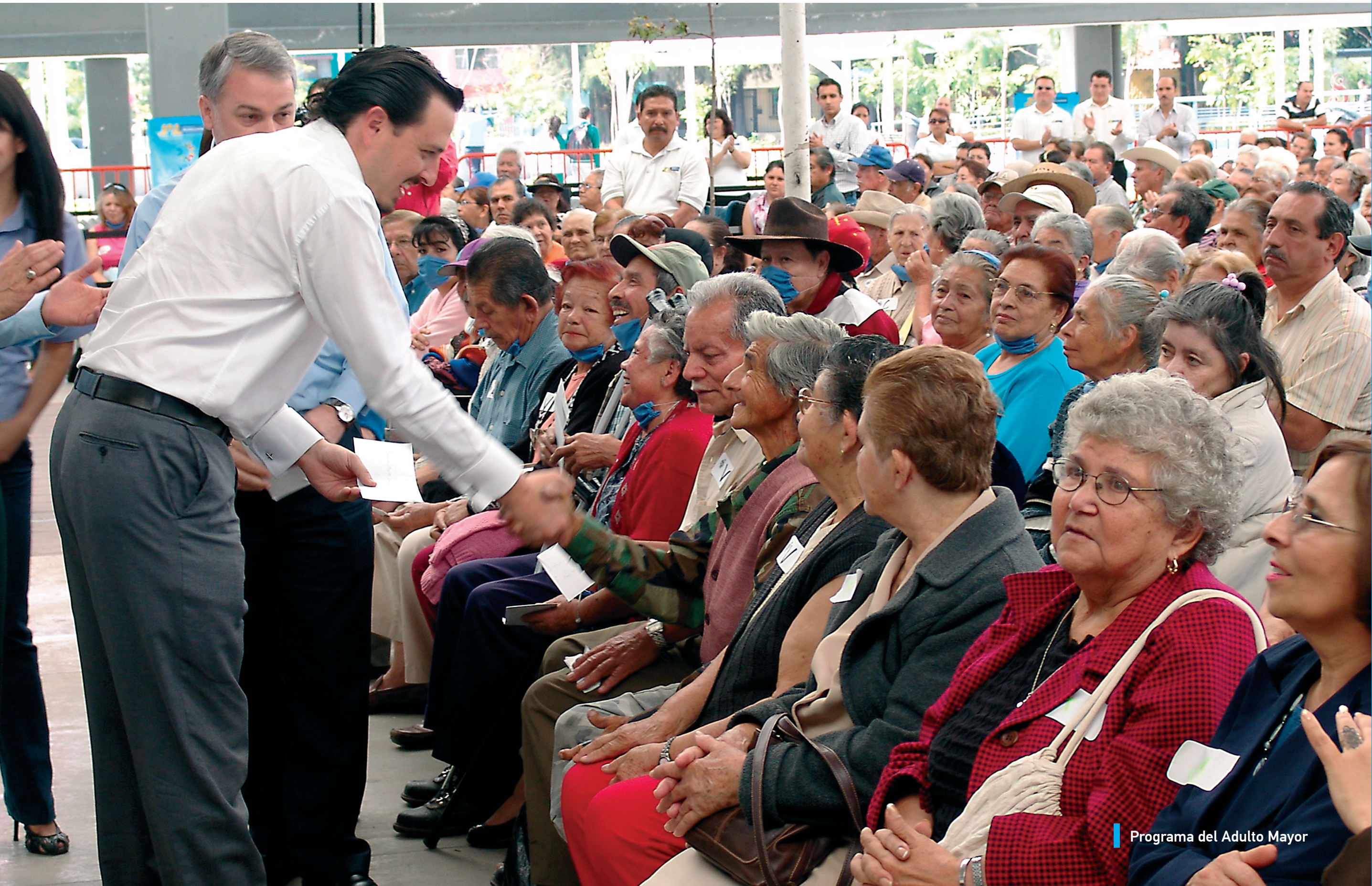
Programa del Adulto Mayor