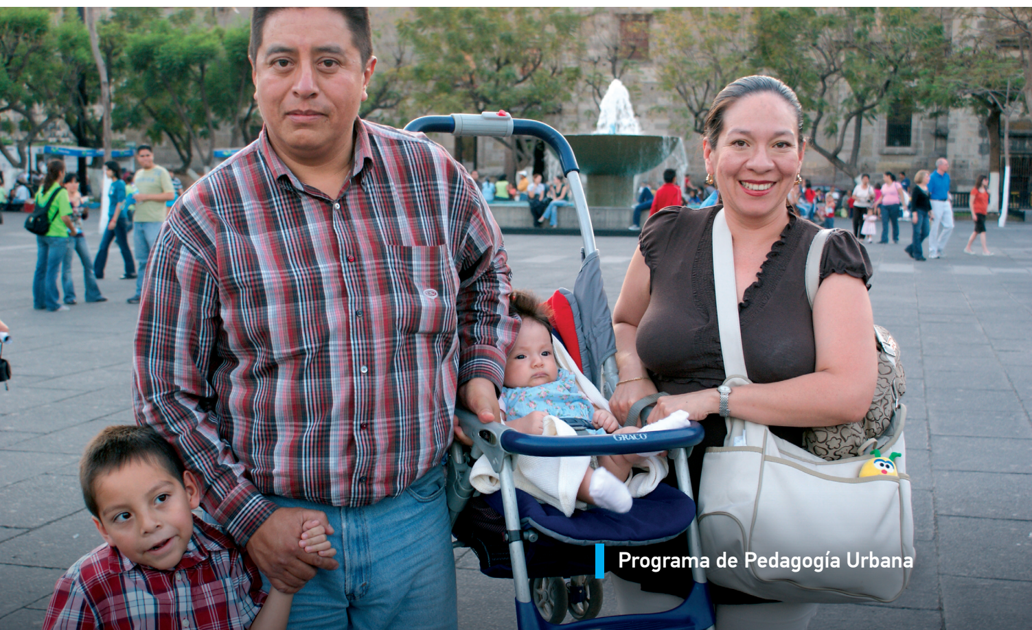
Programa de Pedagogía Urbana

La necesidad normativa: el cumplimiento y respeto de los instrumentos legales en materia de salud pública le da certeza al usuario de que los procedimientos médicos a los que es sometido cumplen con los lineamientos en materia de seguridad sanitaria que marca la autoridad. En este rubro, cabe mencionar que se equiparon las ambulancias para cumplir con la norma 237 de atención pre-