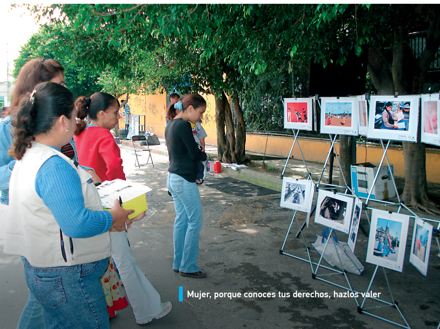
Mujer, porque conoces tus derechos, hazlos valer