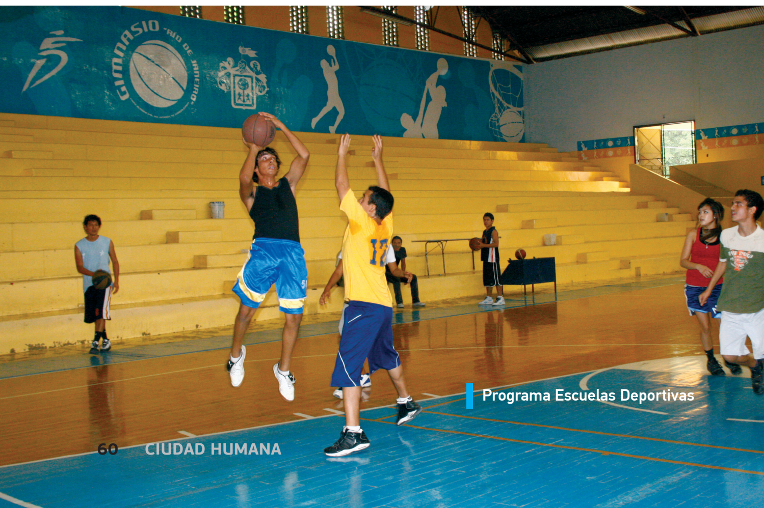
Programa Escuelas Deportivas

El Programa de Ligas Deportivas cumplió el propósito de fortalecer las ligas municipales en todas las disciplinas deportivas que se imparten, asimismo, procuramos su incorporación a los sistemas deportivos estatales y nacionales, asegurando que las personas tengan una vida más íntegra, que aprovechen el tiempo libre y fortalezcan la interacción familiar al satisfacer sus necesidades en armonía con su entorno. Por ello, coordinamos, optimizamos y acrecentamos el funcionamiento de las ligas deportivas, como un programa para la comunidad y de la comunidad que se interesa en la práctica deportiva.