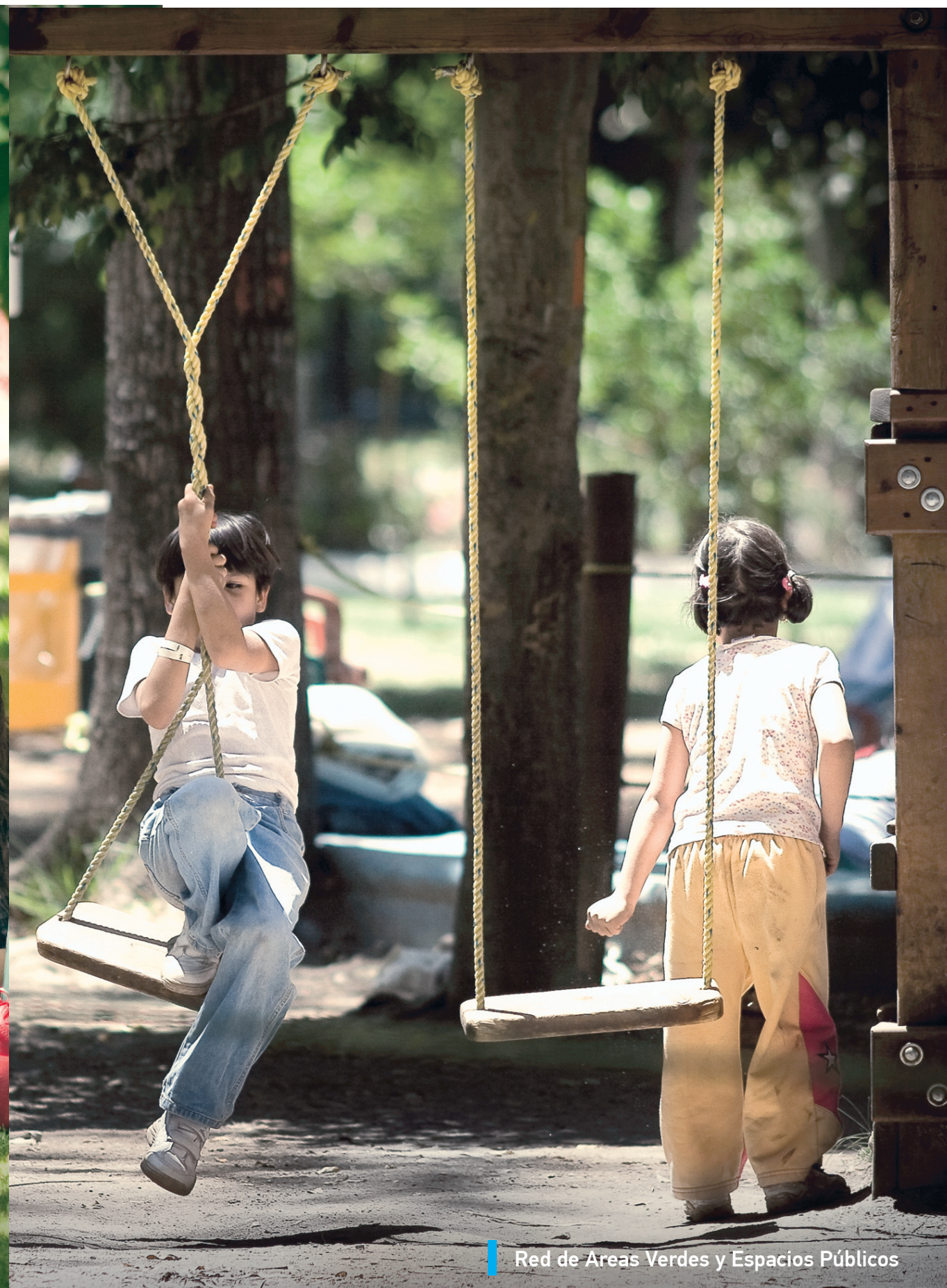
Red de Areas Verdes y Espacios Públicos