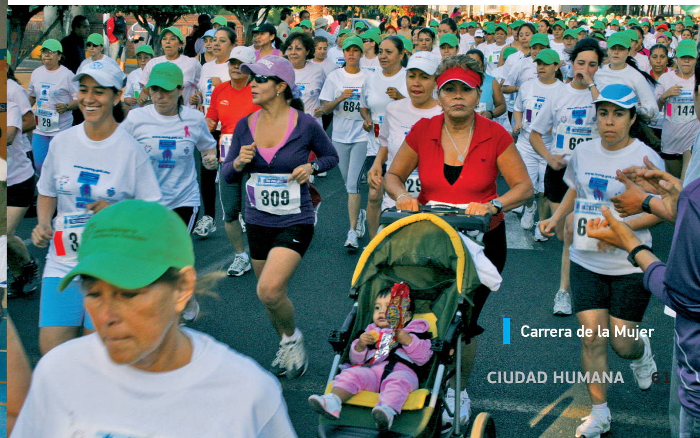
Carrera de la Mujer