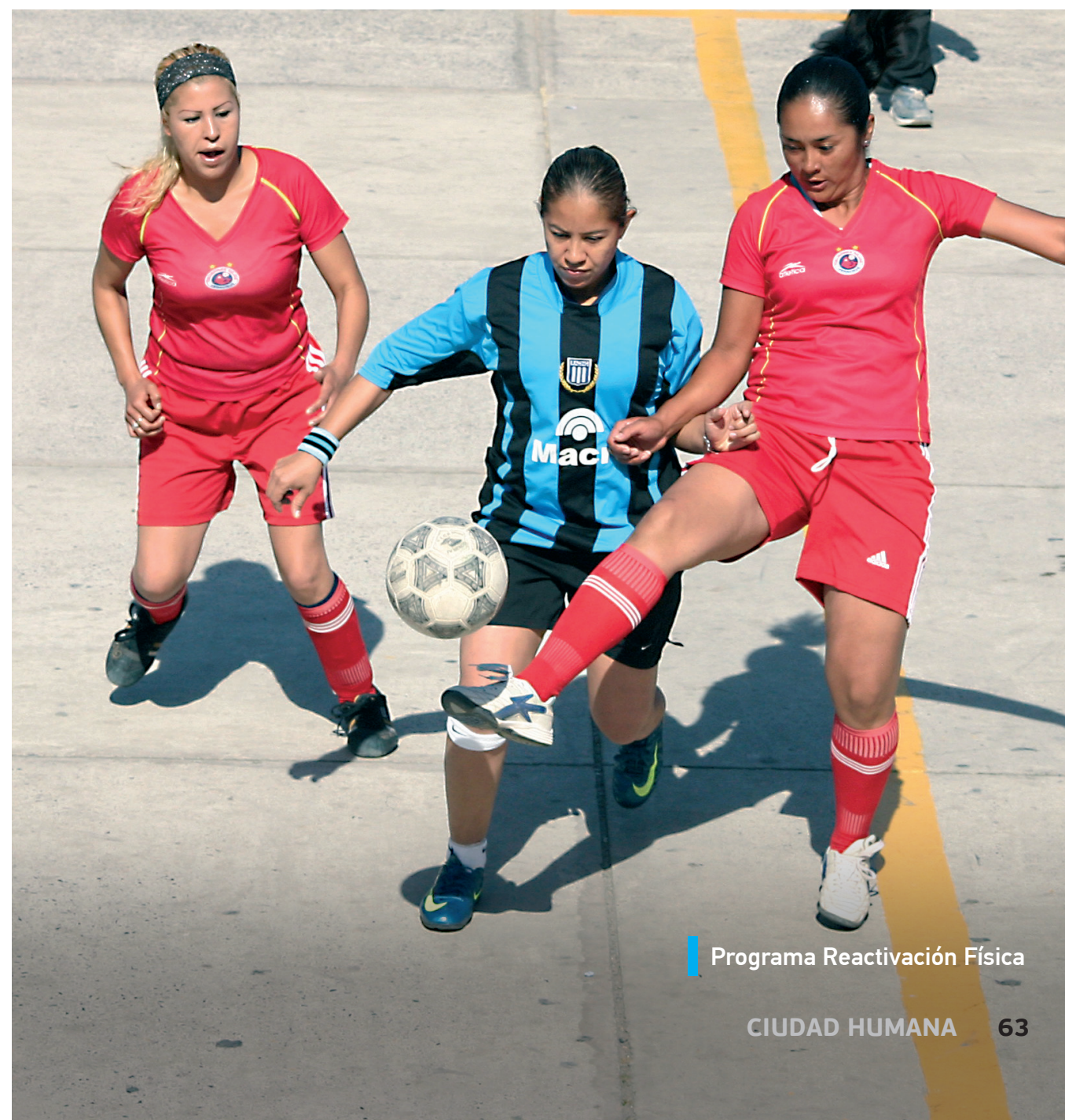
Programa Reactivación Física

Así también, invertimos $33'886,393.34 M.N. y $17'082,830.02 M.N. respectivamente, de las distintas partidas municipales, estatales y federales que fueron asignadas.