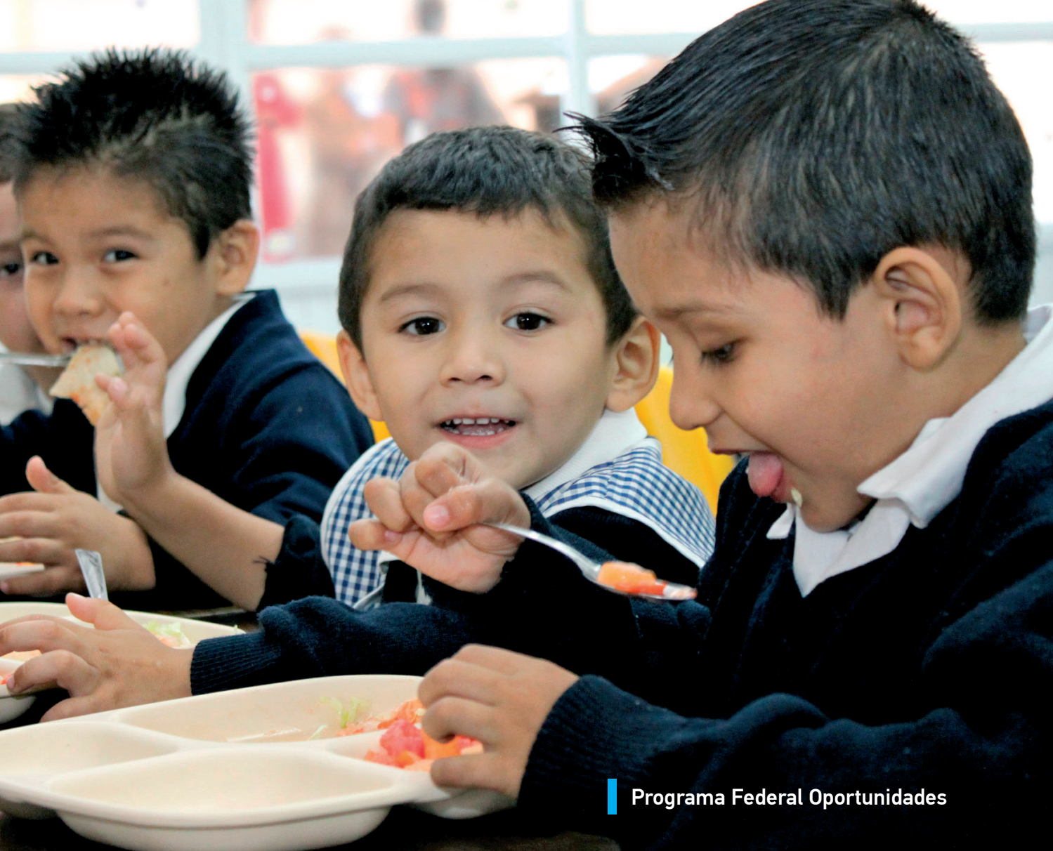
Programa Federal Oportunidades

A través del Programa Ubícate, se han brindado jornadas de salud en donde se difunde la información necesaria para que los jóvenes puedan abordar temas de salud, calidad de vida, participación comunitaria, desarrollo social y ecología. Al cabo de tres años, se realizaron 280 jornadas ubícate, incrementando el número de beneficiados a 19,910 jóvenes.