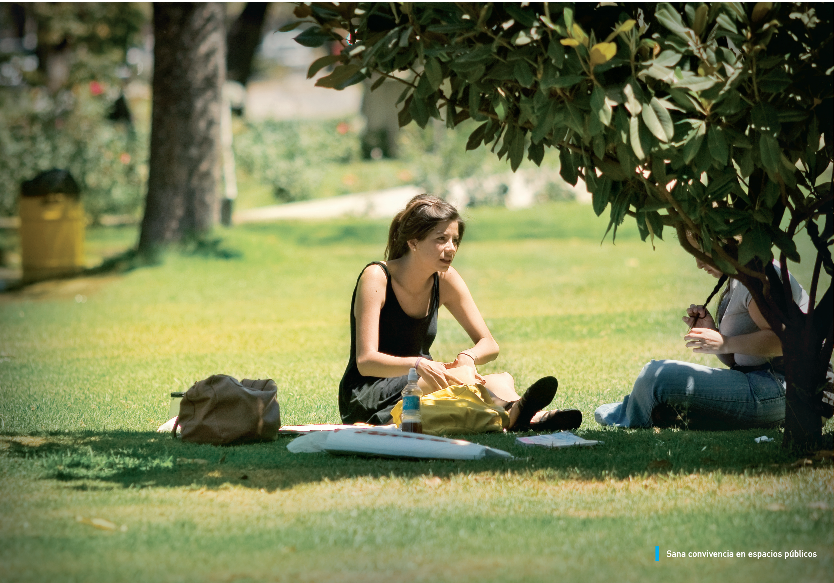
Sana convivencia en espacios públicos