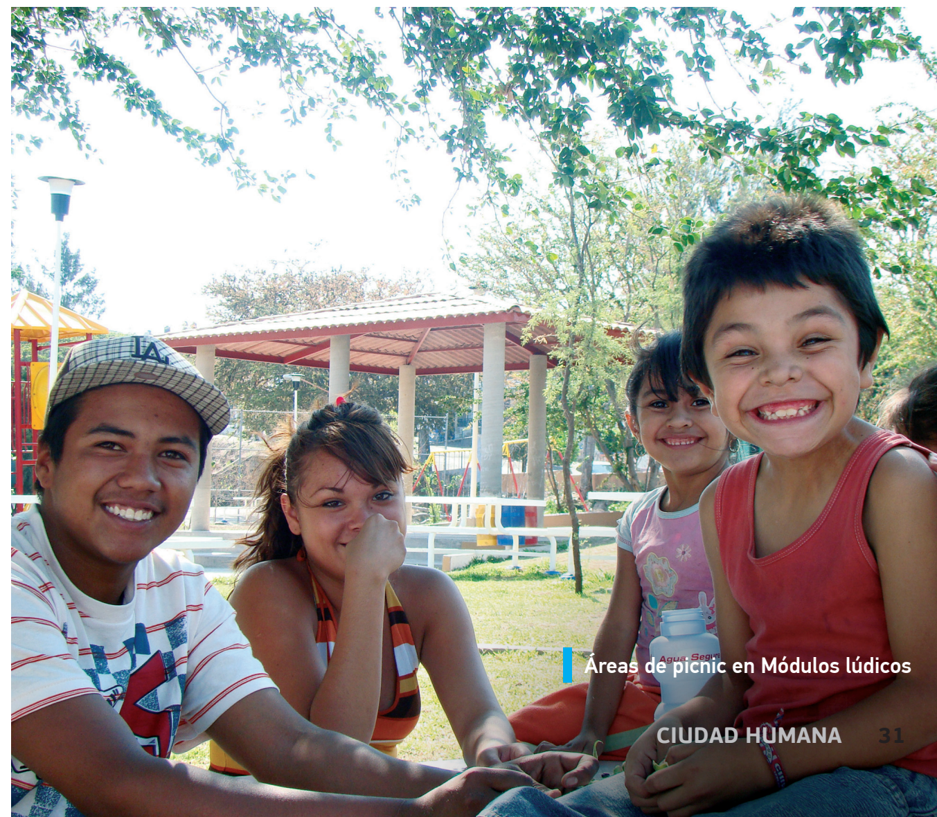
Áreas de picnic en Módulos lúdicos

Por ello, en la Procuraduría Social de la Familia, a través del Programa Atención Integral a la Violencia Intrafamiliar, se han atendido de manera interdisciplinaria 3,884 casos de violencia y 1,867 casos de maltrato infantil. Es importante destacar