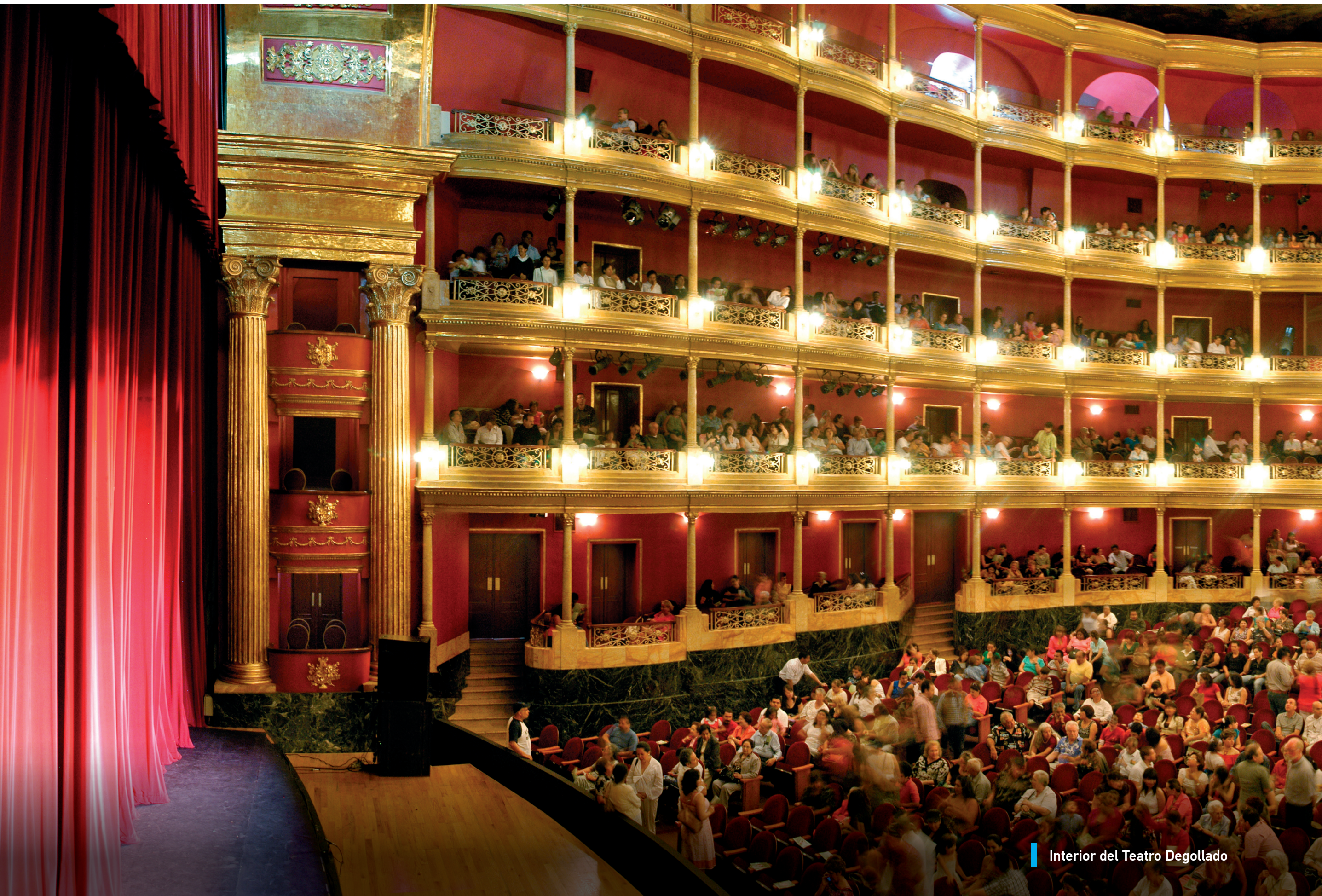
Interior del Teatro Degollado