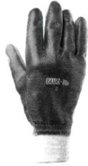
GUANTE VALLEN BLUE LITE NITRILU PUÑO TIPO CALCETIN T-8