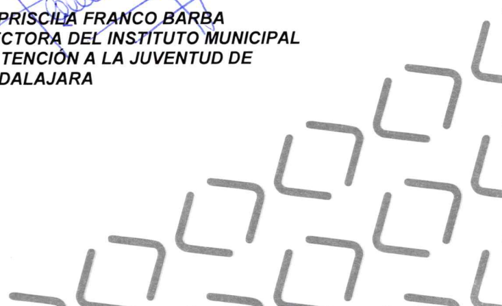
LIC. PRISCILA FRANCO BARBA DIRECTORA DEL INSTITUTO MUNICIPAL DE ATENCIÓN A LA JUVENTUD DE GUADALAJARA